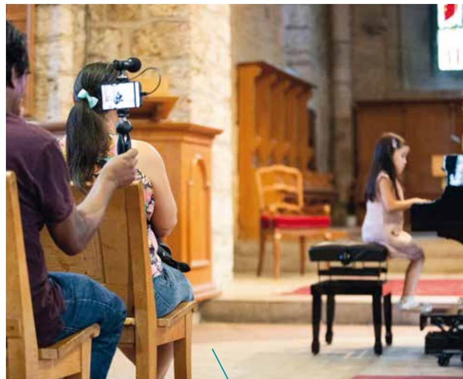
Les semaines musicales sont l'occasion d'assister à des concerts d'élèves, de professeurs, à des auditions et initiations.

150 élèves fréquentent aujourd'hui les cours donnés dans les locaux scolaires de l'Établissement de Villeneuve Haut-Lac, mis à disposition par la commune. Flûte traversière ou à bec, chant, trompette, saxophone, piano, violon ou violoncelle, guitare, clarinette, batterie et percussions : une quinzaine de disciplines sont enseignées au travers des cursus musique classique et musique jazz / actuelle. 16 professeurs, toutes et tous musiciens professionnels et dotés d'un Master en pédagogie ou titre équivalent, sont engagés pour ce