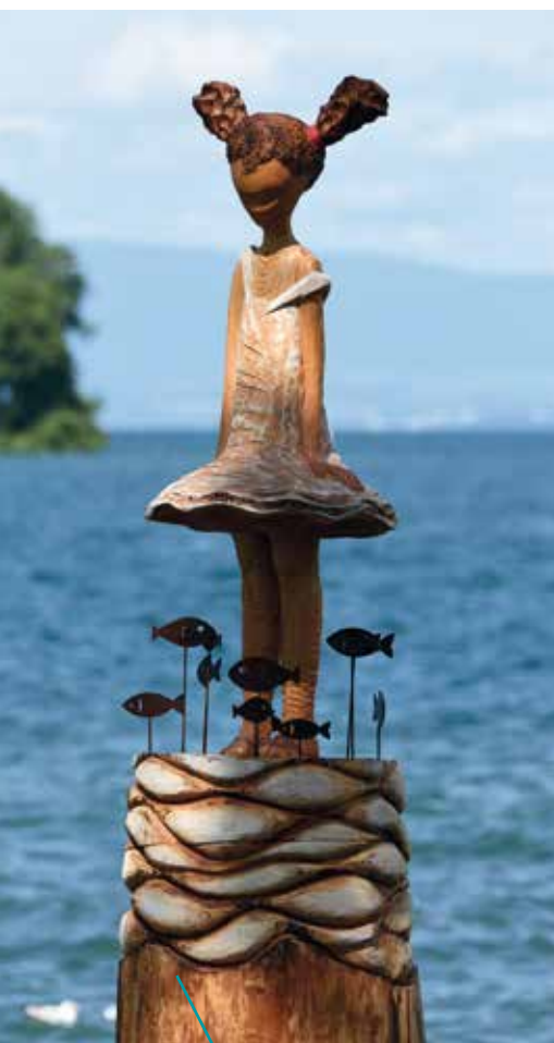
Œuvre réalisée en 2021 sur les quais de Villeneuve par l'artiste italienne Lara Steffe.

LA VILLENEUVE BIENNALE DE SCULPTURES SUR BOIS ANIMERA LES QUAIS DU VILLAGE DU 17 AU 23 JUILLET PROCHAIN. UNE TROISIÈME ÉDITION PLACÉE SOUS LE THÈME « MÉTAMORPHOSE ».