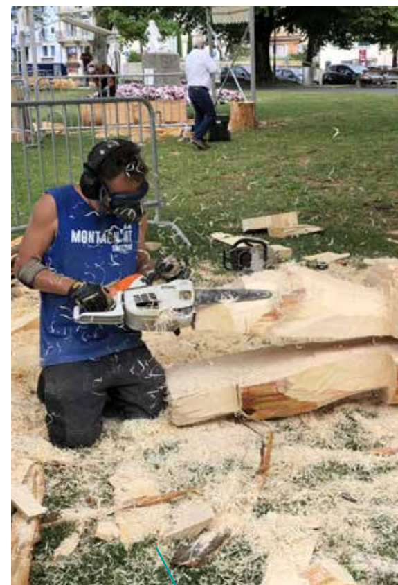
Les sculpteurs à l'œuvre sur les quais de Villeneuve.